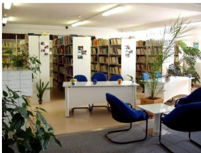
Lekárska knižnica FN v Nitre

Výsledky dotazníkového prieskumu v rámci etickej expertízy v knižniciach budú uverejnené v ďalšom príspevku.